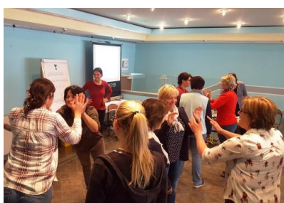
Risikopädagogische und vertrauensfördernde Übungen

Das Team „Gesunder Kindergarten – gemeinsam wachsen“ möchte sich herzlich bei den engagierten Referentinnen sowie bei der Abteilung 6 vom Land Steiermark für die Kooperation bedanken!